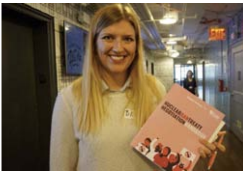
Beatrice Fihn

Im Rahmen der traditionellen Veranstaltungsreihe „Nobelpreisträger in Mönchengladbach“ begrüßt der Initiativkreis die schwedische Juristin und Direktorin der Internationalen Kampagne zur Abschaffung von Atomwaffen (ICAN), Beatrice Fihn . Die ICAN erhielt 2017 den Friedensnobelpreis für „ihre Arbeit, Aufmerksamkeit auf die katastrophalen humanitären Konsequenzen von Atomwaffen zu lenken und für ihre bahnbrechenden Bemühungen, ein vertragliches Verbot solcher Waffen zu erreichen“. Die Veranstaltung am Mittwoch, 20. März 2019 beginnt um 20 Uhr im Audimax der Hochschule Niederrhein.