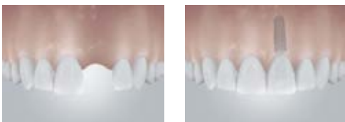
Illustration implantatgetragener Einzelzahn

Jörg Weyel: Dank dieser Trennung zwischen Chirurgie und Prothetik sind Patienten immer in der Hand eines Spezialisten. Die Implantate werden von routinierten Chirurgen gesetzt und nach ihrer Einheilung von kompetenten und erfahrenen Zahnärzten mit den neuen Zähnen versorgt. Ein Weg, den viele Patienten schätzen. Die Planung einer Implantatlösung erfolgt immer im Behandler-Team und mit Blick auf die Wünsche und Möglichkeiten eines Patienten.