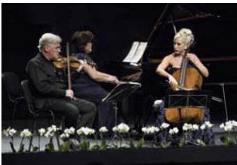
Das Zukerman Trio

Exzellente Solisten und großartige Orchestermusiker bietet die Veranstaltungsreihe „ Solisten und Orchester der Welt in Mönchengladbach “. Am