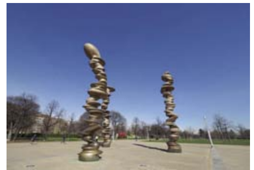
Skulptur von Tony Cragg

Am Dienstag, 18. Juni 2019, 20 Uhr, hält der Künstler und ehemalige Rektor der Kunstakademie Düsseldorf, Tony Cragg , einen Vortrag. Er ist Gast der Reihe „ Pioniere der Welt in Mönchengladbach “. Der aus Liverpool stammende Cragg wurde für sein künstlerisches Schaffen vielfach international ausgezeichnet und ist Ehrenbürger der Stadt Wuppertal und Ehrenmitglied der Kunstakademie Düsseldorf. Einem breiten Publikum bekannt ist er vor allem für seine Plastiken, die er aus verschiedenen Materialien fertigt. Auf Einladung des Initiativkreises erzählt er von seinem Wirken und seinen Werken. Ort ist die Kaiser-Friedrich-Halle.