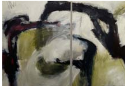
SR ohne Titel 12172 x 100 x 140 © Atelier K&I