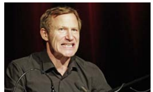
TV-Darsteller Roland Jankowsky besucht im Januar zum 2. Mal das BIS

Telefon: 02161.181300, Bürozeiten außerhalb der Schulferien: Dienstag, Mittwoch, Freitag 10-12 Uhr und Donnerstag 16-20 Uhr.