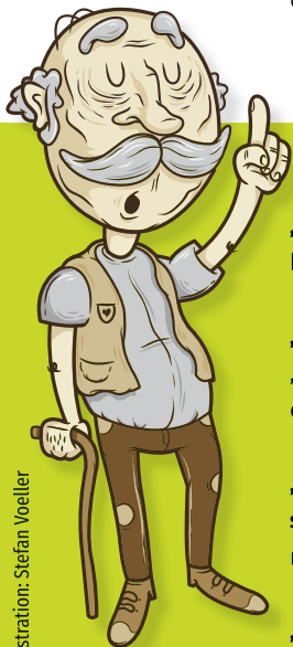
Illustration: Stefan Voeller

„Medde en de Nait fängt d'r nöje Daach aan“ „Mitten in der Nacht beginnt der neue Tag an.“