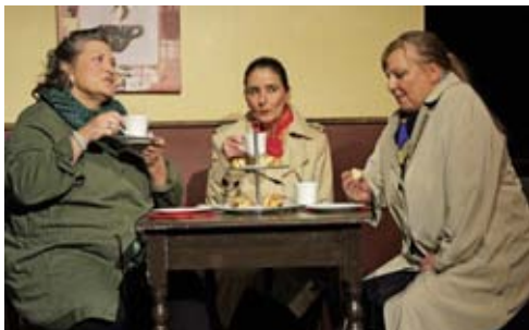
Drei Freundinnen in den besten „Wechsel“-Jahren in der Komödie „Hitzeperiode“.