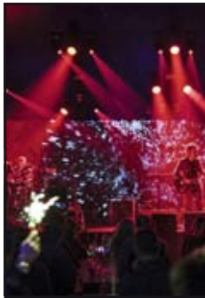
Grafik: Silvana Rückler