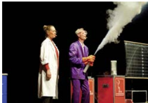
Die Physikanten

Schülerinnen und Schüler können sich 2019 erneut auf eine besondere Wissenschaftsshow freuen: Die „ Physikanten & Co. “ kommen nach Mönchengladbach. Wenn sie die Bühne betreten, wird Physik so witzig wie eine Comedy-Show, glamourös wie ein Abend im Variété oder packend wie ein Fußballenspiel: Stabile 200-Liter-Fässer falten sich mit gewaltigem Knall zusammen oder ein Laserstrahl macht plötzlich Musik und wird zur Bassgitarre. Die Physikanten treten am Freitag, 24. Mai 2019, um 9 und 11 Uhr, in der Kaiser-Friedrich-Halle auf. Die Schulen erhalten Anmeldeunterlagen für die Shows.