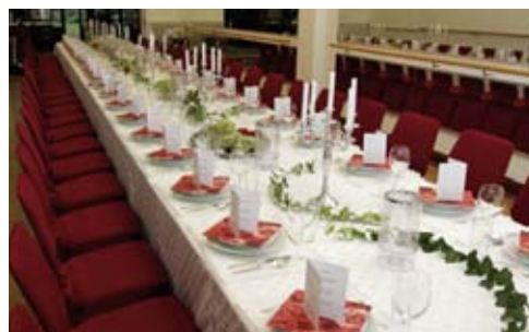
Sektempfang und 3-Gänge-Dinner zur Komödie „Hitzeperiode“